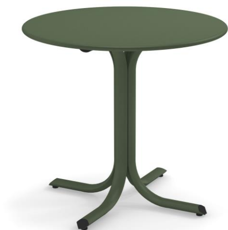
Table System è l'innovativa collezione di tavoli progettata dal Centro Ricerche EMU per rispondere alle molteplici esigenze del settore Contract. Un'ampia gamma di tavoli tondi, quadrati e rettangolari, con piani abbattibili e non; un progetto all'insegna della massima versatilità, per integrarsi naturalmente in qualsiasi contesto e abbinarsi ad ogni modello di seduta EMU.